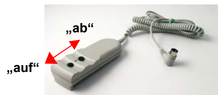
Bild 5.3 Handschalter