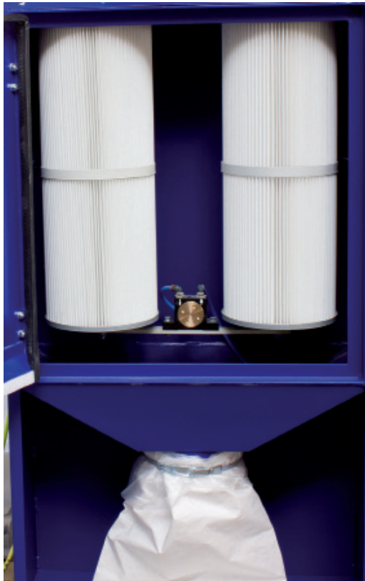
Bild 10. 1 geöffnetes Filtergehäuse

Kann schwerste Atemwegserkrankungen verursachen! Bei allen Reinigungsarbeiten Atemschutzmaske tragen!