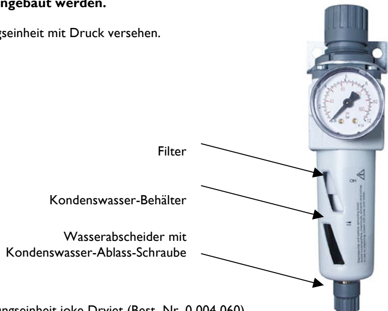
Bild 9.1 Wartungseinheit joke Dryjet (Best.-Nr. 0 004 060)