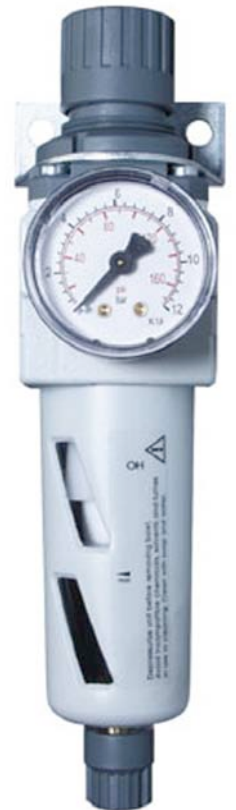
Bild 7.1 Wartungseinheit joke Dryjet (Best.-Nr. 0 004 060)

Die optimale Funktion der Druckluft-Feilmaschine wird durch Einsatz der Wartungseinheit joke Dryjet gewährleistet.