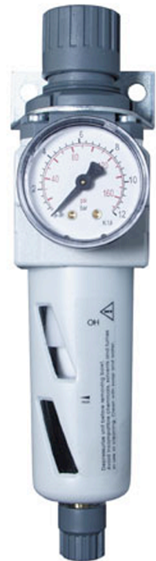
Figure 7.1 Unité de conditionnement joke Dryjet (Réf. 0 004 060)

Le recours à l'unité de conditionnement joke Dryjet garantit le fonctionnement optimal de la machine à limer pneumatique.